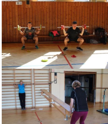
RegioTÜF „Functional Fitness 4XF“ am 30.03.2019 beim TV Eutingen

Die Regio-Stammtische erfreuen sich besonderer Beliebtheit. Hier wird diskutiert, sich ausgetauscht und von anderen Vereinen gelernt. Im November trafen sich 24 Vereinsvertreter/innen, darunter auch viele Mitarbeiter/innen der Jugendvorstände, beim TV Ersingen und tauschten ihre Erfahrungen zum Thema Jugendarbeit im Verein aus. Ein Impulsreferat lieferte interessante Anregungen und Tipps zum Aufbau und den Aufgaben eines Jugendvorstandes. Der Jugendausschuss des TV Nöttingen war als Best-Practice-Beispiel vor Ort und stellte in beeindruckender Weise seine Arbeit vor.