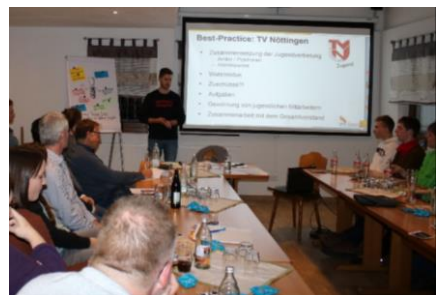
Regio-Stammtisch „Jugendarbeit im Verein attraktiv gestalten“ am 21.11.2019 beim TV Ersingen